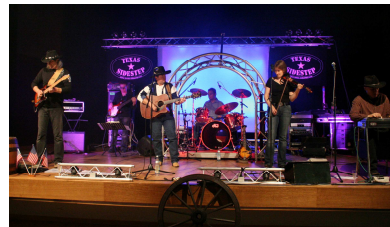
TEXAS SIDESTEP (FR)