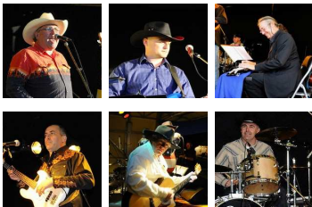
THE NASHVILLE BAND (FR)